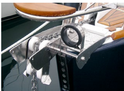
Bogbeslag integrerat med bogankarbeslag.