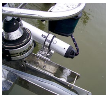
Montering på sidan av ett bogankarbeslag.