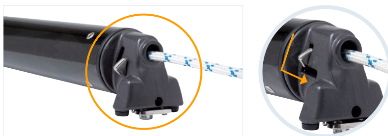
Fjäderbelastad låsning för enkel och säker hantering.