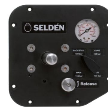
Kontrollpanel, 4 funktioner