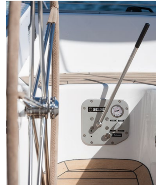
Kontrollpanel, 4 funktioner med pumphandtag

Att eftermontera en mast-jack i en befintlig mast är ett omfattande arbete och kan endast utföras på ett begränsat antal mastprofiler från Seldén. Ett villkor är självfallet att masten är genomgående, dvs att den står på kölen och inte på däck. Det enklaste sättet att få denna funktion är att specificera den vid köp av ny mast eller ny båt.