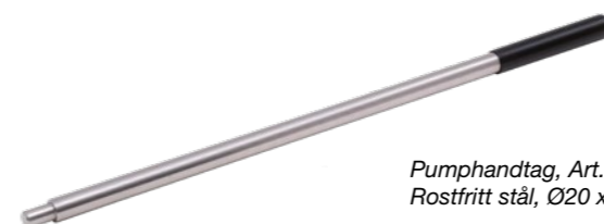
Pumphandtag, Art. nr. 587-101-01 Rostfritt stål, Ø20 x 500 mm