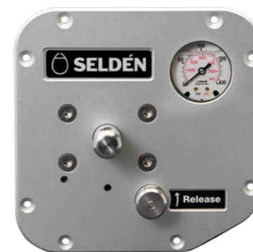
Kontrollpanel, 1 funktion