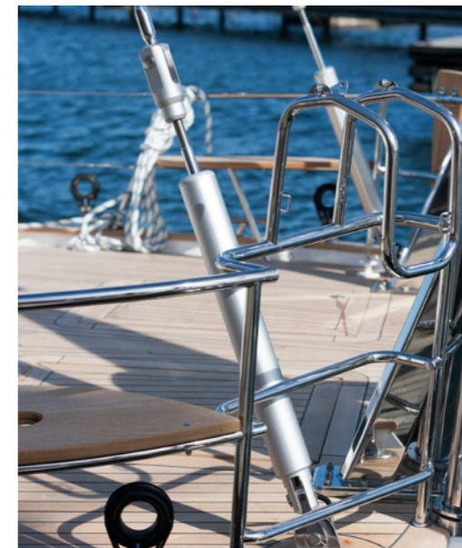
Hydrauliska akterstagssträckare (HT) för kontrollpanel